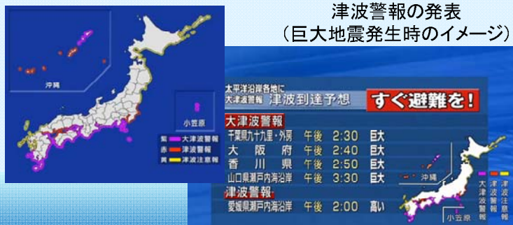
津波警報の発表 (巨大地震発生時のイメージ)

「巨大」の場合、東日本大震災クラスの津波が来ると思って、直ちに高い場所に避難しましょう。