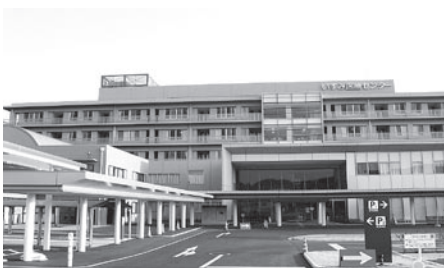
▲いすみ医療センター

夷隅郡市消防本部の平成二十年度の救急出動は三千六百五十二回で、そのうち御宿町は三百八十六回の約十一%を占めております。いすみ医療センターは、平成二十年度は内科がありませんでしたが、今年度に内科医が配属され、輪番制により内科の救急が