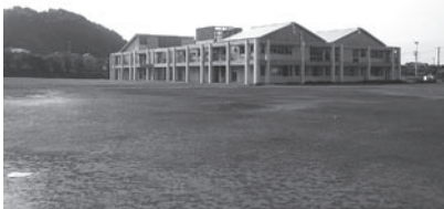
▲御宿中学校の運動場

A 平成二十四年度に屋内運動場の建設、二十五年度にグラウンドの整備をする予定でございます。建設に係る予算につきましては、体育館、柔剣道場、グラウンド整備で約五億八千万円ということでございます。建設の規模につきましては、体育館、柔剣道場で建築面積が千四百四十七、五九㎡、