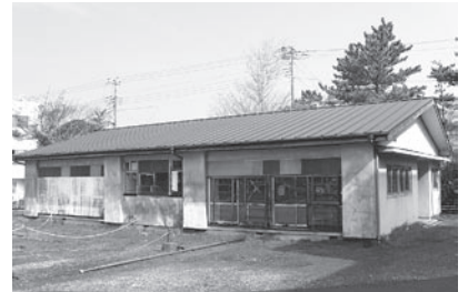
▲旧社会福祉協議会の建物

A 御宿町には現在庁舎を含めまして約六十棟の施設があります。このうち使用する予定の施設については二十七年までの耐震化を進め旧社会福祉協議会や火葬場など今後の使用が見込めないことから廃止する建物が約九棟ございます。旧社会福祉協議会の建物は老朽化が