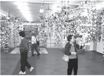
▲おんじゅくまちかどつるし雛めぐり

後継者育成については、商工業が業として成り立つ事が重要であり、大型店と競合しない家族経営の利点を生かした大型店等の経営方針を分析し、それぞれの業を検討研究した経営戦略が必要と考えています。