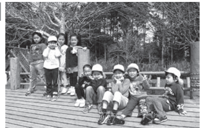
▲御宿保育所の遠足(布施小学校にて)

A 芝生による緑化、またグラウンドカバープランツということで、二つのすばらしいご提案をいただきましてありがとうございます。