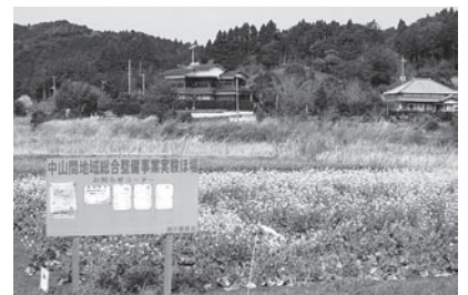
▲中山間地域総合整備事業実験ほ場

A 町長に就任して以来、はや一年になろうとしておりますが、公約に掲げました福祉、教育、文化の振興、環境政策を含め、観光や漁業、農業、商業の振興、そして行財政改革と多面にわたりますが、二十一年度予算につきましては、 では、直近のテーマ、課題については、可能な範囲で予算化させていただきました。 実施項目といたしまして、報酬五十%カット、町長専用車の廃止、環境浄化チームや定住化促進チームの設置、これは継続事業として実施してまいります。臨時交付金を活用しての障害者福祉政策の実施、観光面におきましては、町内再整備や、先にご承認いただきました観光案内所建設に關してのこと、また議員の皆様方、町民の皆様方の多くのご支援、ご協力をいただいていたの四百周年記念事業の実施、福祉、子育てにおける乳幼児医療、小学校入学前児童への助成拡大、中学生までの入院費無料化、フレックスタイムの試行導入、町長懇談会や町長室の開放などを実施してまいりました。 二十二年予算に係る事業につきましては、福祉、教育、文化の振興に關して、そして観光を中心