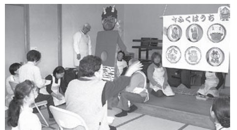
▲ほっとサロン (地域福祉センター)