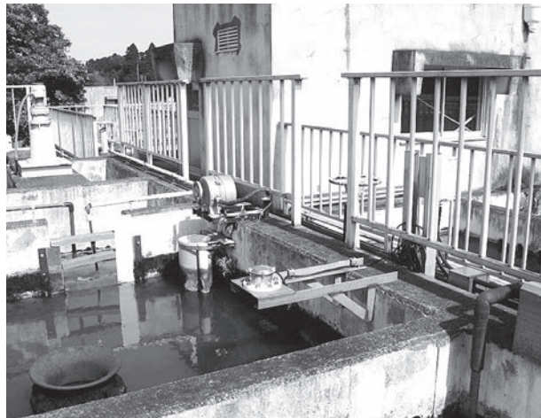
▲交換される原水流量計(御宿町浄水場)

浄水場原水流量計交換に伴う浄水場中央監視盤の改造費用として建設改良費の補正を行いました。