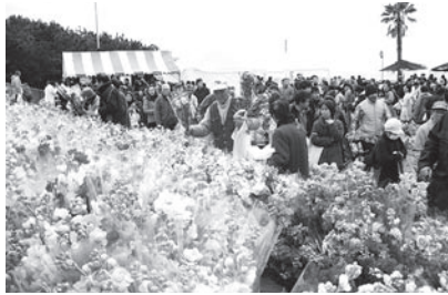
▲春一番!おんじゅく海の花祭り

A 平成二十年度決算状況を見ますと、経常収支比率八十八・二%、財政力指数〇・五五九、公債費比率十三・一%、積立金現在高五億八百万円、そのうち財政調整基金が二億五千五百万円、そして学校建設基金が一億四千八百万円で、他は減債基金等となっております。地方債のこれからの償還状況を見ますと、平成二十一年度から二十三年度まで年々およそ四億三千万円を償還いたします。二十四年度から徐々に減少いたしました三億八千万円、二十五年に三億五千万円となっております。このような財政状況の中