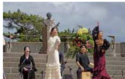
2023年 千葉県誕生 150周年を記念し、日西墨友 好の絆事業を実施しました。(画像は交流コンサー トで披露されたスペイン舞踊フラメンコ)