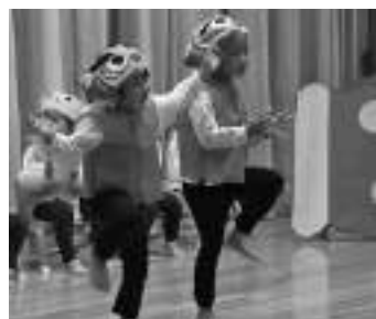
動物たちを元気に演じる2歳児クラス

おんじゅく認定こども園にて発表会が開催されました。今回はこども園が始まって以来初めての、2歳から5歳児クラス合同での開催となりました。