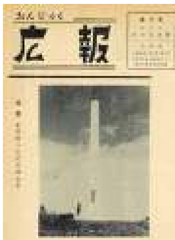
1958年 戦禍により朽ち果てていた 日西墨交通発祥記念碑が復旧され、 竣工式を執り行いました。 (右画像は挨拶するスペイン大使)