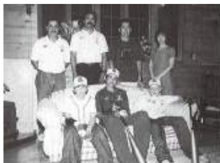
2003年 メキシコ少年野球チームが御宿にホーム ステイ。この年で11回目の受け入れとなりました。