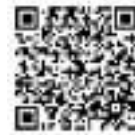
▲マイナンバーカード 方式ログイン画面は こちらから