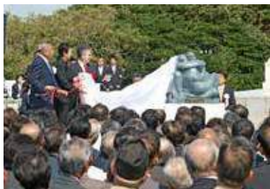
2009年 サン・フランシスコ号漂着 400周 年記念に関する式典が行われ、メキシコ政府 からは彫刻「抱擁」、スペイン政府からイサベ ル女王勲章が贈呈されました。