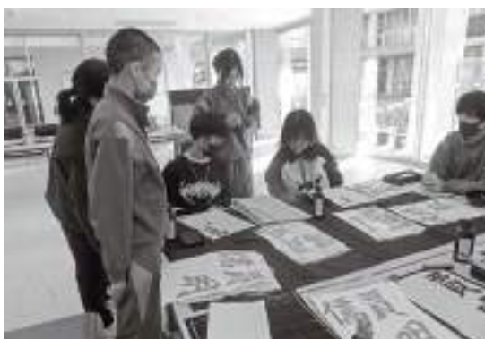
台湾の中学生は初めての書道体験

12月16日、県訪日教育旅行交流事業の一環として、台湾・桃園市立大成国民中学校の皆さんが御宿町を訪れ、御宿中学校の生徒と交流しました。御宿中学校では歓迎式典が開催され、両校により記念品を交換しました。台湾の生徒からは、英語による学校紹介が行われ、御宿中学校の生徒からは剣道や柔道の技が披露され、互いの学校や文化を紹介し合いました。