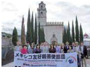
2013年 メキシコ・テカマチャルコ市との姉 妹都市協定が締結されました。