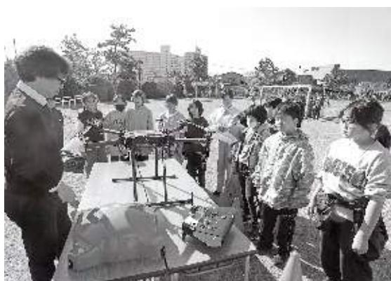
ドローンについて熱心に学ぶ子どもたち

また、ドローンの実際の飛行も行われ、上空を飛ばすドローンから送られるモニター映像を観察しました。映像を通じて、どのような情報が得られるのか等の説明を受けた子どもたちは、ドローン技術に対する関心を深めたようです。