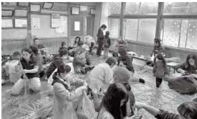
お飾り作りの様子

「寄茶場」は交流の場づくりの御宿町のモデル事業として、地域住民、三育学院大学等と協働して、平成 30 年にスタートしました。コロナ禍で長らく開催が中止になっていましたが、再開を望む声上がり、今回は実谷区の皆さんが主体となつての開催となりました。子どもも大人も久しぶりの「寄茶場」を楽しんでおり、主催である実谷区の皆さんは、「今後も地域が盛り上がるような活動を考えていきたい。」と、これからの展望を話してくれました。