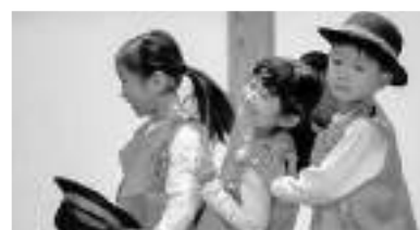
マイケル・ジャクソンに なりきって踊る5歳児クラス

子どもたちは先生たちと共に、この日のために練習を重ねてきました。子ども達の成長を感じる発表会となりました。