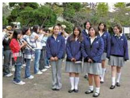
2008年 メキシコの日本メキシコ学院の生徒た ちが御宿を訪問し、町民と交流しました。