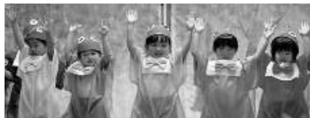
色とりどりのカエルになった3歳児クラス