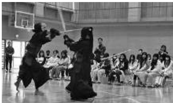
剣道を観戦する台湾の中学生たち

12月16日、県訪日教育旅行交流事業の一環として、台湾・桃園市立大成国民中学校の皆さんが御宿町を訪れ、御宿中学校の生徒と交流しました。御宿中学校では歓迎式典が開催され、両校により記念品を交換しました。台湾の生徒からは、英語による学校紹介が行われ、御宿中学校の生徒からは剣道や柔道の技が披露され、互いの学校や文化を紹介し合いました。