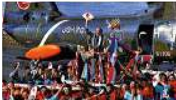
1978年8月 メキシコ・アカプルコ市と姉妹都市締結し、同年11月 にはロペス大統領が御宿町を訪れました。