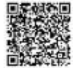
▲マイナポータル連携 の詳細はこちらから