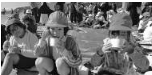
マラソン後のイセエビ汁は最高！

マラソン後には、御宿町観光協会より、子どもたちに温かいイセエビ汁が振る舞われました。子どもたちは、冷えた体を温めるイセエビ汁を、嬉しそうに味わっていました。