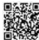
▲ eTAX 「個人住民税の電子化に係る特設ページ」はこちらから