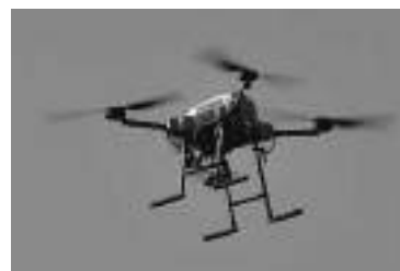
御宿小学校の上空を飛ばすドローン

この特別授業では、まず講師からドローンの基本的な説明があり、その後ラジコンカーの操縦実演が行われました。子どもたちは実際にラジコンカーを操作して体験し、楽しみながら学びました。