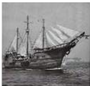
1988年 日本・メキシコ修好 100 周年を記念し、ガレオン船マリガラ ンテ号が御宿へ寄港しました。