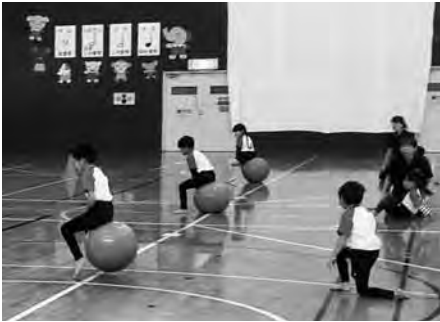
▲ぽよんぽよん競争（年長） ボールを上手に使ってジャンプ！

おんじゅく認定こども園の年中と年長の子どもたちによるリズム体操教室の発表会が町B&G海洋センター体育館で行われました。