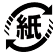
▲リサイクルマーク