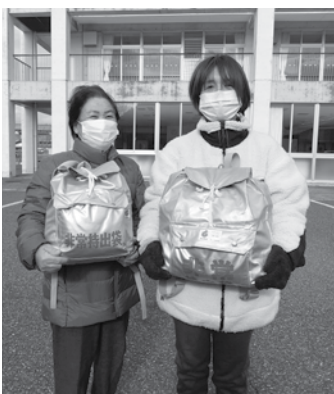
▲防災バックを持って避難した方

また、訓練参加者の中には、防災バッグを持って避難している方もおり「能登半島地震をきっかけに防災バッグを準備し、避難場所まで一人で持つてこれるか確認しに参加しました。」という方も。その他にも、「ヘルメットがあればよかった。」「災害が起きてからでは、時間がなく、事前に防災バッグを用意しておくべきだった。」という意見が聞かれ、防災について見直すきっかけとなりました。