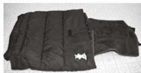
▲バッグの外側が レジャーシートに