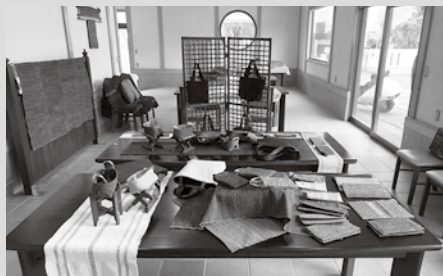
▲「裂織展示・体験会」の会場の様子

御宿町地域おこし協力隊として着任して、ちょうど1年が経ちました。この一年間、私自身様々な方と知り合いお世話になる中で、さらに交流の輪が広がっています。