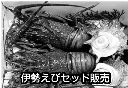
伊勢えびセット販売

内 容 伊勢えび2尾・サザエ2個 数 量 300個限定 販売時間 9:00から 毎年6時前から列が出来るほどの人気セット。