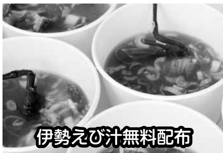
伊勢えび汁無料配布

内 容 伊勢えびを使ったえび汁無料配布 価 格 無料 数 量 1人1杯(800人限定) 配布時間 10:30から 丁寧に出汁をとっているので伊勢えびの風味を 存分に愉しめます。