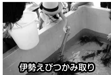
伊勢えびつかみ取り

内 容 専用トングで捕まえられる 体験型(1回2尾) 数 量 500人 販売時間 9:30から 毎年長蛇の列ができていほど、とても人気。