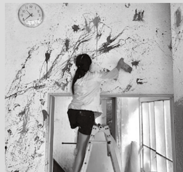
▲駅前拠点御宿ベースキャンプ ソイルペイントでこどもたちが自由にペイントしました！

8月26日(月)には私も所属している商工会青年部でこども向けにONJUKU海のスポーツ体験会を実施します。中央海岸にて海と御宿を好きになっていただけたらなと思い、青年部の仲間たちが企画しています。ぜひ、お誘い合わせの上、ご参加いただければ幸いです。(御宿町商工会ホームページよりお申し込みください。)