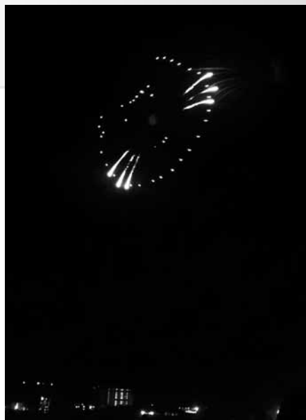
▲子どもたちが喜ぶキャラクター花火