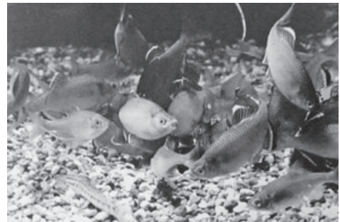
▲天然記念物ミヤコタナゴ