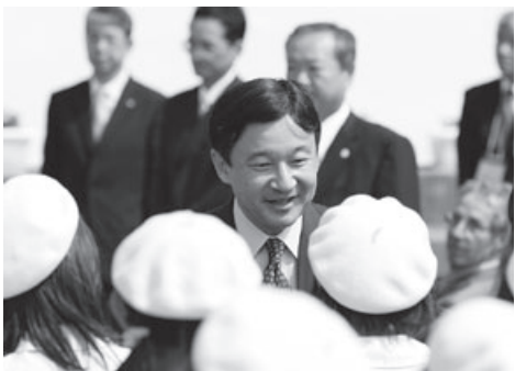
▲皇太子殿下、御宿町へご訪問

町消防団分団統合 駅前観光案内所竣工 メキシコ友好親善使節団派遣 日西墨友好の絆記念日制定