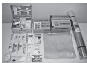
▲購入した災害対策用品