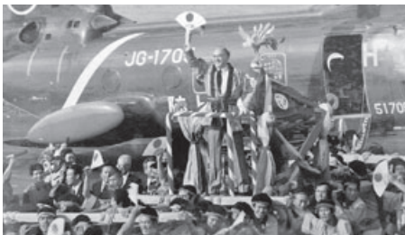
▲メキシコ大統領来町