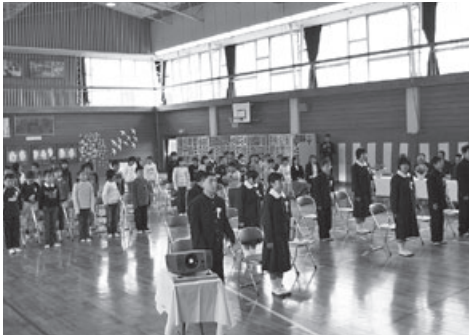
▲岩和田小学校最後の卒業式

町消防団、消防庁長官表彰旗受章 「活力あるふるさとづくり基金」スタート 御宿小学校校舎及び体育館耐震化工事完了