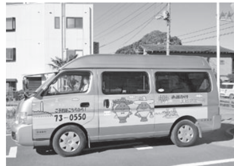
▲御宿町乗合運行「エビアミー号」