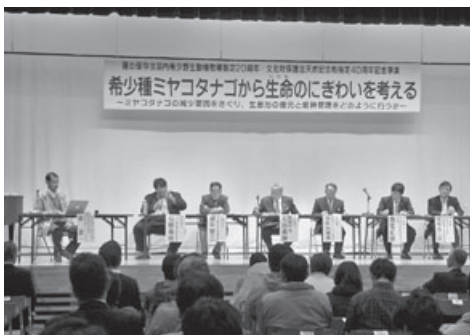
▲ミヤコタナゴシンポジウム御宿

御宿中学校グラウンド整備完了 千葉工業大学と包括的連携協定調印 日本メキシコ学生交流プログラム実施 御宿町乗合運行「エビアミー号」運行開始 ミヤコタナゴシンポジウム御宿開催