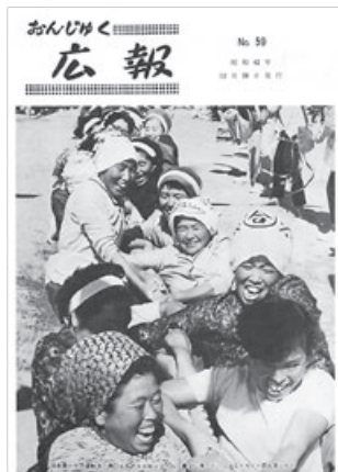
▲全国広報コンクール1位受賞

平成26年11月10日から12月5日までの期間、合併60周年を記念して、住民の皆さんが広く参加できる記念事業を募集し、7件の応募がありました。 協議の結果、その中から「御宿町の民話の伝承事業」「郷土芸能発表会」の2つに決定しました。 この事業は平成27年度に実施予定です。詳細につきましては、決まりしだいお知らせします。