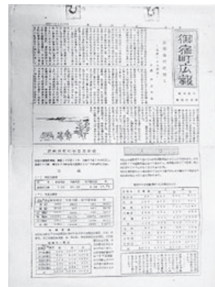
▲御宿町広報創刊号