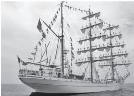
▲クワウテモック号来航

町消防団、消防庁長官表彰旗受章 「活力あるふるさとづくり基金」スタート 御宿小学校校舎及び体育館耐震化工事完了