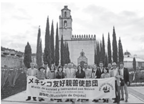
▲メキシコ友好親善使節団

メキシコ・アカプルコ市「日墨交通発祥記念碑」を建立 原動機付自転車の御宿オリジナルナンバープレート交付開始 家庭用ごみ指定袋制開始