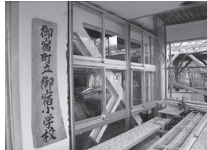
▲御宿小学校耐震改修後