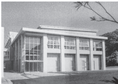
▲新御宿中学校体育館

御宿中学校グラウンド整備完了 千葉工業大学と包括的連携協定調印 日本メキシコ学生交流プログラム実施 御宿町乗合運行「エビアミー号」運行開始 ミヤコタナゴシンポジウム御宿開催