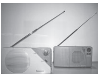
▲防災行政無線戸別受信機