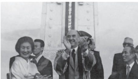
▲メキシコ記念塔建立 50周年記念式典

昭和 30 年 町村合併促進法に基づき御宿町と浪花村の一部（岩和田地区）と布施村の一部（上布施、実谷、七本地区）が対等合併し新しい御宿町が誕生