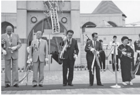
▲月の沙漠記念館完成式