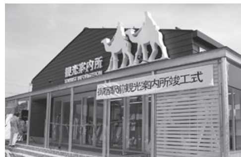
▲新しくなった観光案内所