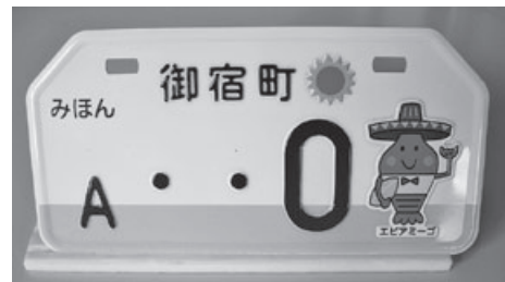
▲御宿オリジナルナンバープレート