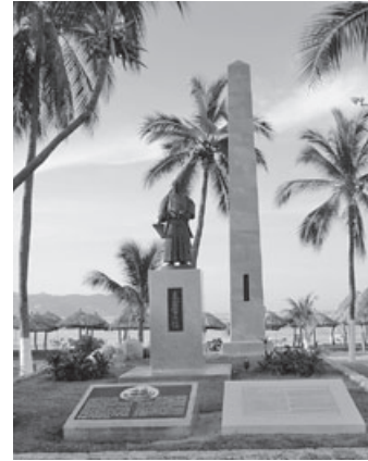
▲アカプルコ市 「日墨交通発祥記念碑」

東日本大震災が発生 光ブロードバンドサービス供用開始 駐日スペイン大使来町 メキシコ合衆国下院議長来町 高齢化率が 40%を超える 日独交流 150 周年記念事業「菩提樹植樹祭」