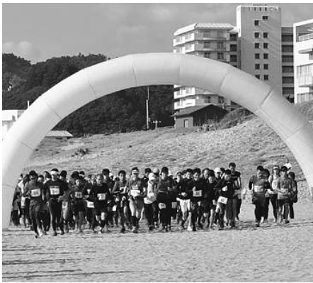
▲100名を超える参加者が一斉にスタート

この「おんじゆくトレイル」を利用 したトレイルランニングの大会が 1月9日に早速行われ、全国から集 まった109名が御宿の自然の中を 駆け抜けました。