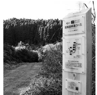
▲各コースの入り口に設置された案内標識

今回のお披露目企画では、整備し た全てのトレイルコースを舗装路で つなぎ、特別コースも含めた約12km の道のり。途中でリタイヤする事も なく、おんじゆく自然を満喫し、 参加者は笑顔でゴールできました。