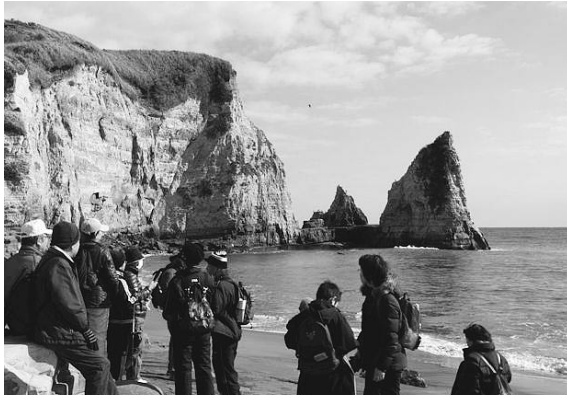
▲お披露目会では大波月もコースの一つに

完成したばかりのトレイルコース お披露目企画として、「おんじゆく トレイルを歩こう！」と題したトレ イルウォーキング企画が1月14日か ら18日まで実施され、延べ125名 が参加しました。地元の方に混じり インターネット等で開催を知った町 外からの参加者も見受けられました。