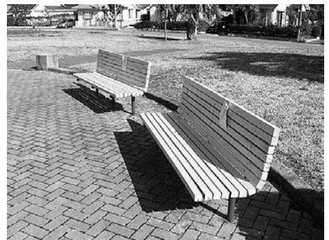
御宿台地区では、自治会や西武不動産販売(株)と協力し、御宿台中央公園の整備を行っています。(腐食していた木材の補修やベンキを塗り直した公園のベンチ)

この度条例制定した『御宿町活力あるふるさとづくり基金条例』は、こうした協働によるまちづくりをより直接的かつ効果的にするため、寄附を通じて、寄附者が使途について具体的な施策を指定するといった新たな協働手法を構築するものです。民意を施策へ直接反映させることによって、まちづくりへの住民参加の機運が広く醸成されるものと期待されます。