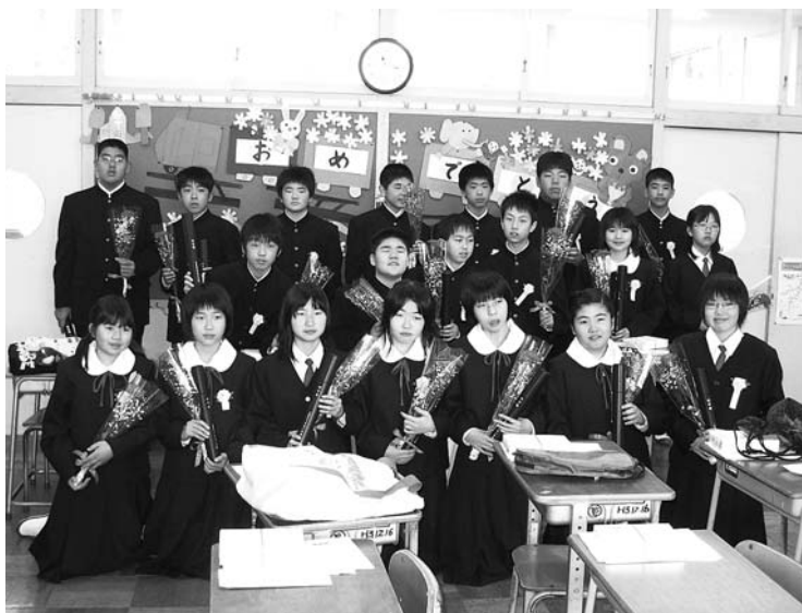
▲布施小学校の卒業生は1クラス 卒業式終了後、教室に戻ってみんなで記念撮影を行いました