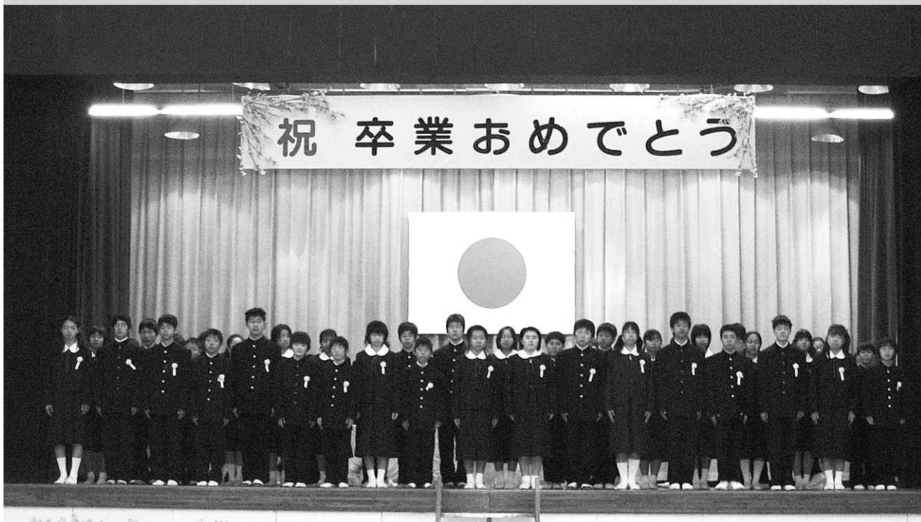
▲御宿小学校では、ステージの幕が上がり、壇上から卒業生が入場しました