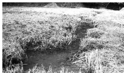
▲水田を復旧し、ミヤコタナゴが生息できる環境を維持します

町では、国指定の天然記念物ミヤコタナゴの保護活動を推進するため、役場や各小学校での飼育を通じた啓発活動のほか、環境保全への取り組みを継続的に行っています。