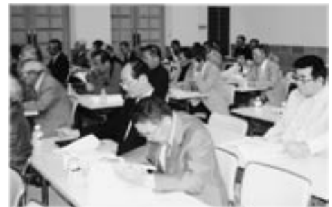
新旧区役員会議の様子