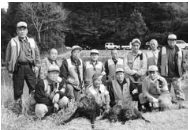
勝浦市猟友会と協力しあい、効率的に捕獲できました。

町では今後も有害鳥獣捕獲の強化徹底を推進するほか、有害鳥獣から農作物などを守る事業として、今年度も電気柵・物理柵(金網の柵)の設置への補助を行います。今後も駆除と防御のバランスをとりながら、被害の防止に努めます。