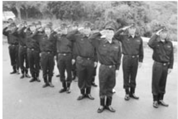
今年度から消防団員となりました。