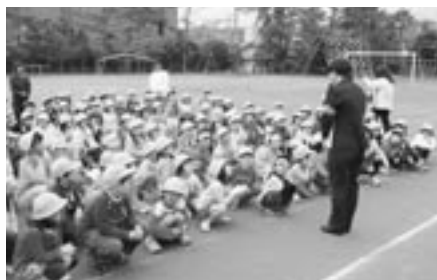
御宿小学校の交通安全教室の様子