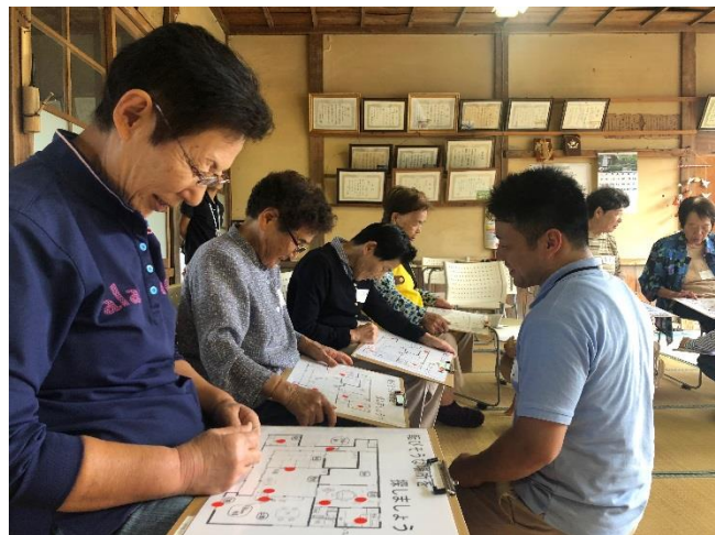
▲家の中で転倒しそうな場所を真剣に考えています

今回は三育学院大学の学生が家の中の整理整頓やちょっとした工夫による転倒予防を中心に話をしました。