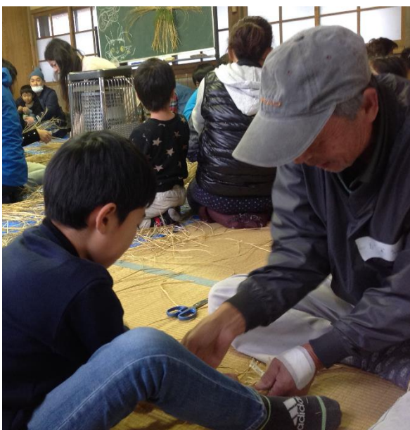
▲高齢者と子ども達がしめ縄を一緒に作る姿

ロコミやチラシを見て、しめ縄飾りを作りたい方が多く集まり、今まで参加したことがない高齢者や親子も多く参加しました。制作中も地元の高齢者の周りに子ども達が集まり教わっている姿がとても印象的で、時間を忘れるくらい楽しく過ごしました。