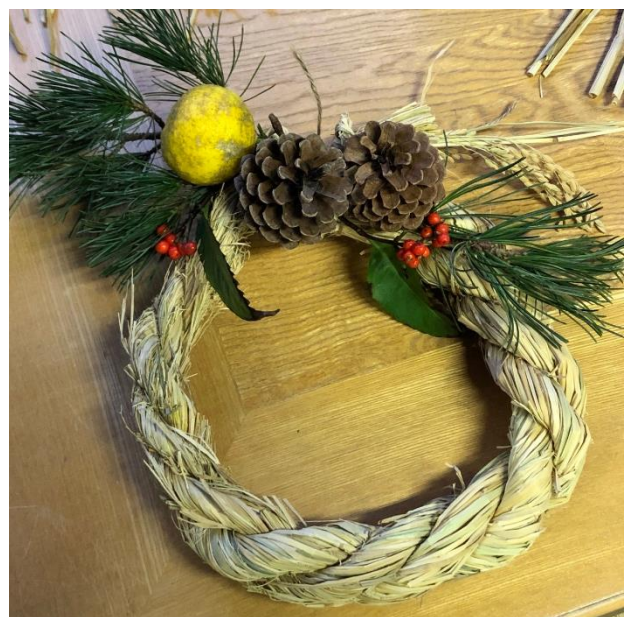
▲完成したわら細工

地域住民も「かしこまったことはせずに今回のような伝統を継承しながら多世代交流が出来るのが一番良い」と話していました。今後もこの意見のような高齢者と子ども達が自然と交流できる内容を実施していきたいと思います。