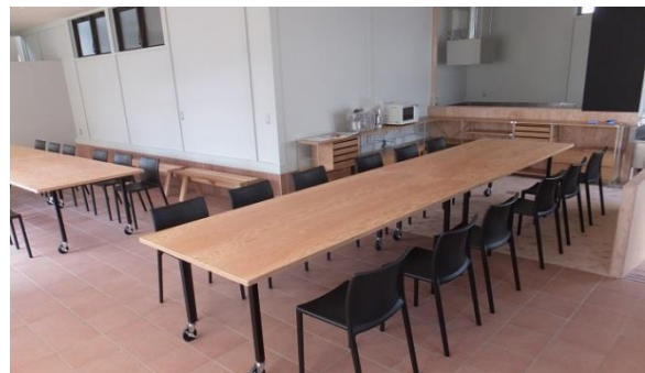
▲改修後の産品開発及び交流拠点施設

引き続き、新鮮な地元食材、地域産品を活用した特産品の開発や新メニューの開発に向けた研修会等を行う産品開発拠点として、また、食を通じた地域情報の発信、多目的な町のラウンジ、交流の場としての活用を検討、地域資源を生かした「にぎわい」の創出を目指します。