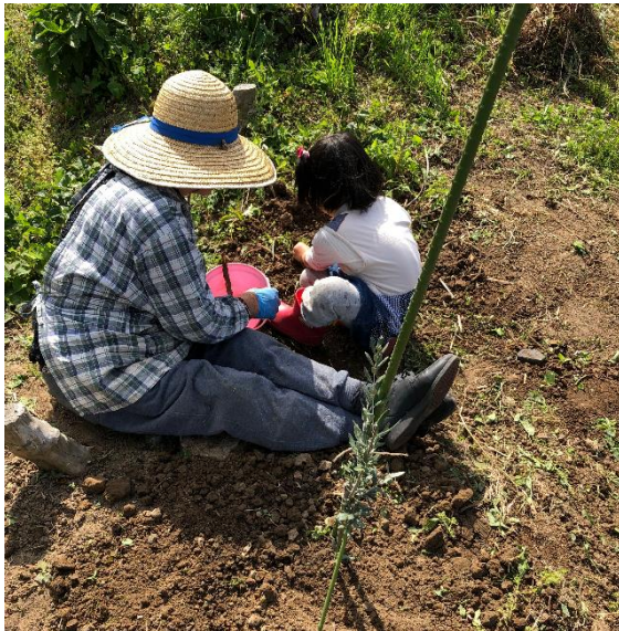
▲子どもと高齢者が一緒に草むしりしている風景

今回も以前と同様、実施にあたり、地域住民の方を中心に事前に植える場所の選定や事前準備、三育学院大学の先生と打ち合わせ、役場産業観光課、企画財政課の協力を得るなど寄茶場がよりよいものになるよう実施しました。