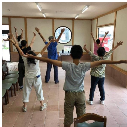
▲ラジオ体操交流会

令和元年度は、地域おこし協力隊が浜地区の交流拠点である旧白鳥丸水産の建物を活用し、AOZORA café おんじゅく、裂織作品展、ラジオ体操交流会、バヌアツ写真展など様々な行事を開催し、参加者の交流を図りました。