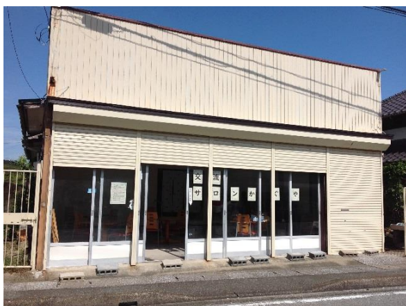
▲新しい交流の拠点「かぐや」(新町)

今後は、地域おこし協力隊、ボランティア等との協働により、健康づくりや介護予防、多世代交流、子育て支援など様々な事業を展開していく予定です。