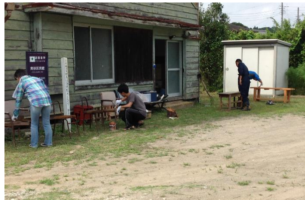
▲住民と学生がニスを塗っている姿

8月22日（木）に、実谷区民館で地域と三育学院大学の方5名が実谷区民館の草むしり、椅子のニス塗りを実施しました。