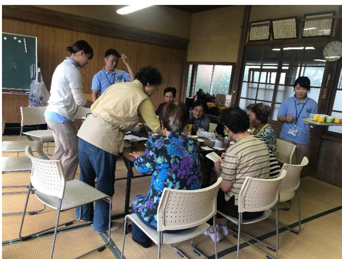
▲学生と住民がお茶を飲みながら談笑しています

今後は、寄茶場 in 実谷&七本を開始して1年が経つため、寄茶場の方向性を住民と話し合っていきたいと思います。