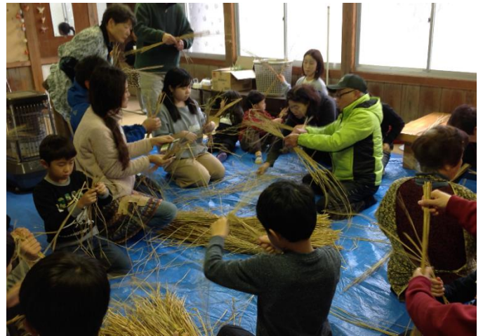
▲高齢者からしめ縄作りを教わる子ども達

今回は、お正月のしめ縄飾りやわら細工を総勢43名の高齢者、親子、三育学院大学の学生で作成しました。