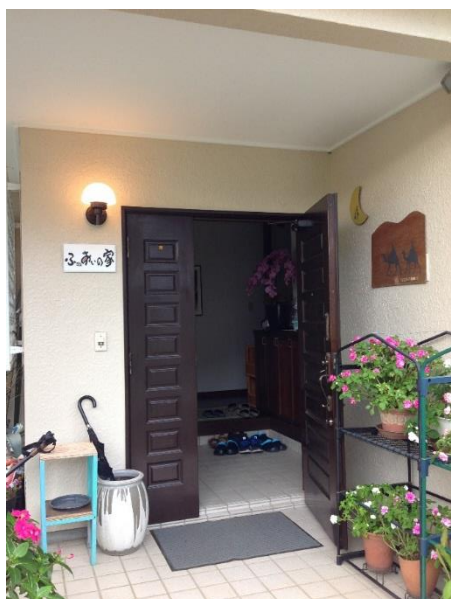
▲交流スペース「ふれあいの家」（御宿台）

交流スペース「ふれあいの家」は、11月9日から毎週土曜日に御宿町の住民の交流並びに多世代間交流の場としてのサロン活動を開始し、新型コロナウイルス感染拡大防止のため、2月29日から3月にかけて一時的に閉所しましたが、令和元年度は合計15回サロンを開催し、330人の方が利用しました。