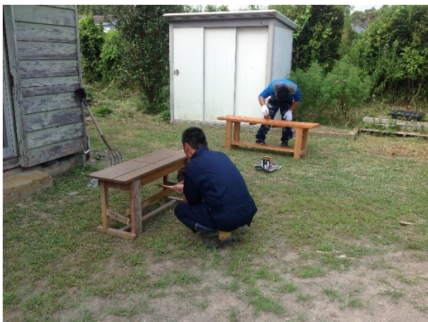
▲ベンチがきれいになるように丁寧に塗っています

今回、実谷区民館の敷地内の草が生えてきたことや「第6回寄茶場 in 実谷&七本」できれいにしたベンチや椅子をさらに長く使用できるようにニスを塗ることの提案があり、有志で実施しました。