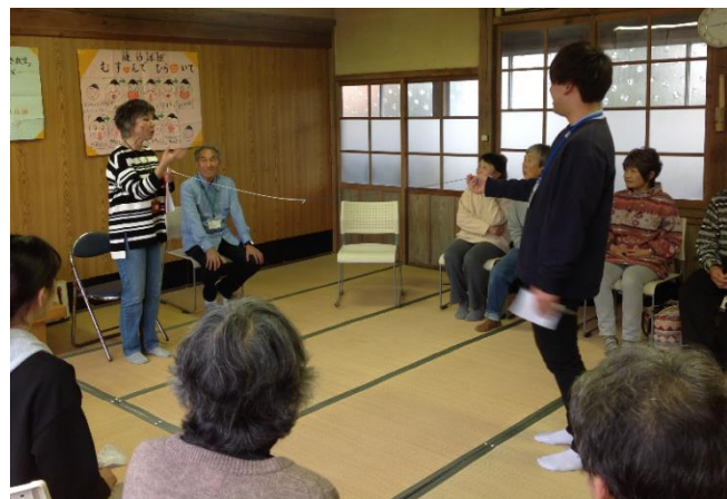
▲一回のくしゃみで唾が飛ぶ距離について話している姿

今回は、「新型コロナウイルス感染症にかからないために」をテーマに三育学院大学の学生、教員から手洗い、咳エチケットなどの講話を実施しました。総勢15名の高齢者と学生等が参加者し、基本的な感染予防対策について学びました。