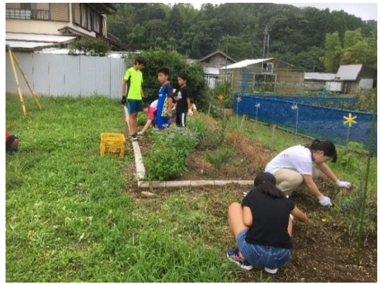
▲子どもたちが一生懸命草むしりしています

今回は、「オリーブ&ハーブ園草むしり&空間づくり」をテーマに総勢25名で実谷区民館をきれいにしました。