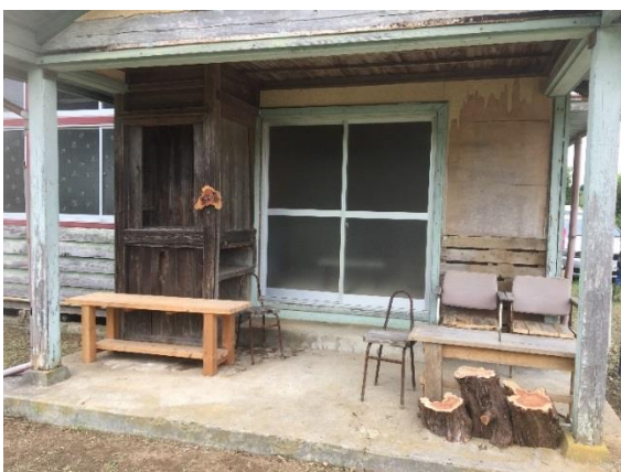
▲きれいになった実谷区民館の軒下