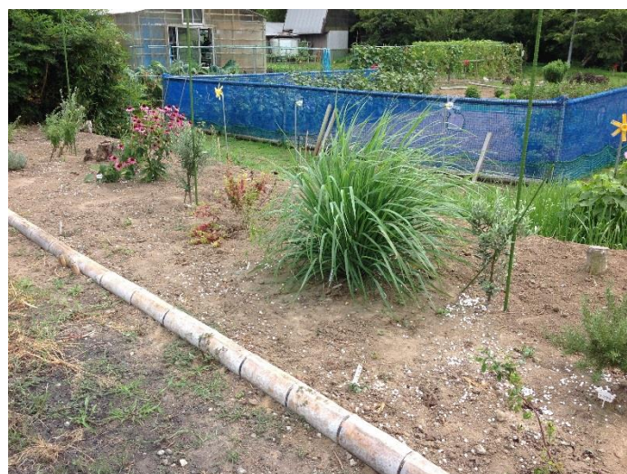
▲きれいになったオリーブ&ハーブ園

このようなちょっとした集まりが地域づくりに繋がるため、今後増えていくことを期待します。