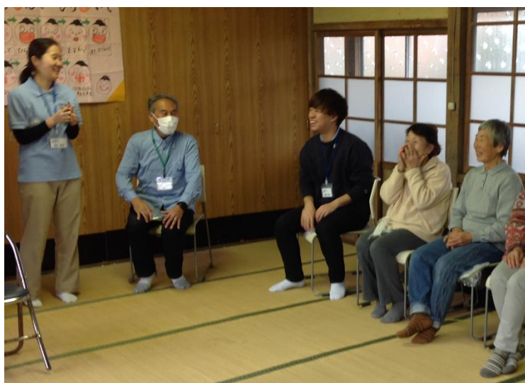
▲談笑しながら情報交換している姿

今後は、季節ごとに地域の子ども達と高齢者が交流できるように、今までの学びを活かしながら地域が活性化するよう地域住民と三育学院大学と協働していきたいです。