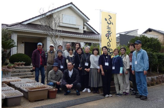
▲利用者とボランティアの皆さん

その後、補助金を活用した交流サロン事業の第1号として、御宿台の方々を中心とした「ふれあいの家」が、民家を活用した交流スペースを11月に開設しました。