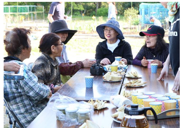
▲グリッシーニを食べながら談笑しています

参加者は「特別なことは求めてなく、集まるのが大事」という声があり、今後も気軽に子どもから大人まで集える場所作りを住民の皆さんと作って行きたいと考えています。