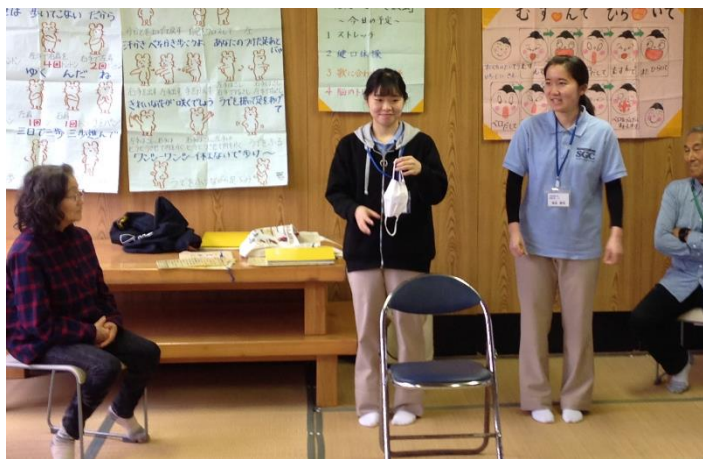
▲マスクの正しい着脱について話す学生

また、講話後は実谷区民館で育てているハーブティを飲みながら学生、地域住民と交流や新型コロナウイルス感染症の情報交換を行いました。