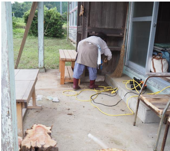
▲実谷区民館をきれいにしている姿

今回、実谷区民館の軒下が物置になっているのをきれいにし、ちょっとした休憩場所として活用する目的と子どもたちがサッカーなど遊べる場所として活用できるようにしたい地域の思いから実施することになりました。