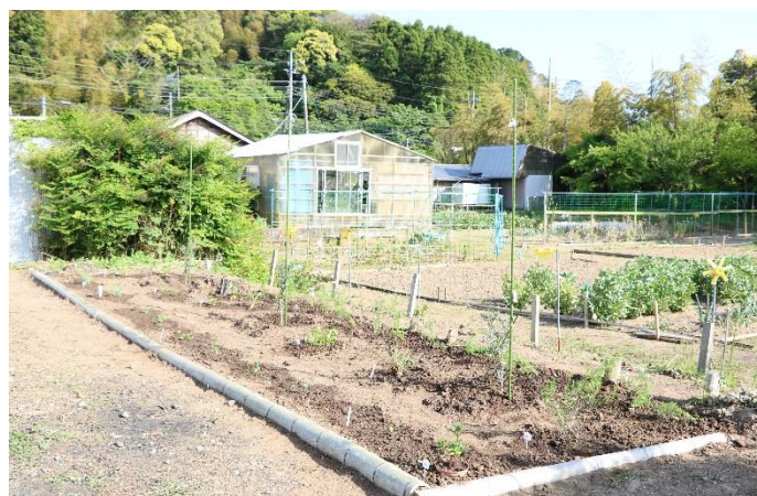
▲実谷区民館に作ったオリーブ&ハーブ園