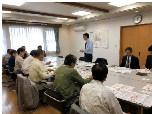
▲地域課題に関する勉強会・意見交換会

御宿台地区からの依頼により、地域の支援に取り組むための先進地事例の紹介や地域の実情に沿った活動実施に向けての提言等を受けるため、平成31年4月25日（木）に、株式会社ちばぎん総合研究所を招いて「高齢化が進む地区における生活・移動困難の現状と対応について」をテーマに、地域課題に関する勉強会・意見交換会を開催しました。