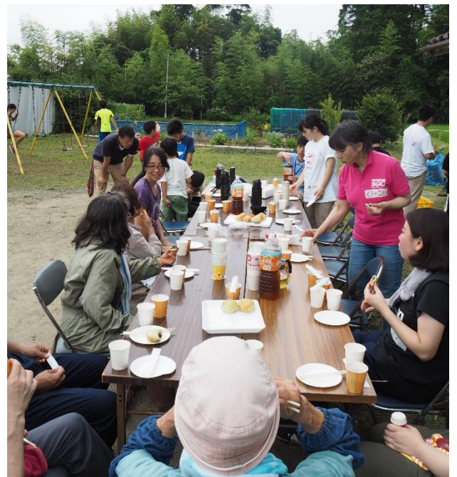
▲オリーブアンパンを食べながら休憩中

きれいになった実谷区民館やオリーブ&ハーブをさらに活用し、地域を盛り上げたいと思います。