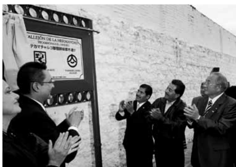
▲テカマチャルコ—御宿姉妹都市通りにて

翌23日には、ドン・ロドリゴ・デ・ビベロ・イ・アベルサが眠る16世紀初頭に建築されたサンフランシスコ修道院の建築学上の説明、ご案内があり、後に200m程の小道を「テカマチャルコ御宿姉