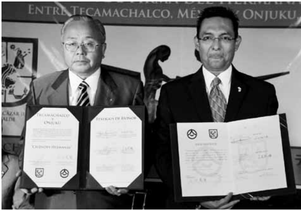
▲調印書 御宿町長とテカマチャルコ市長