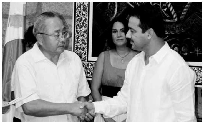
▲アカプルコ市表敬訪問

アカプルコ市が9月中旬に熱帯暴風雨による大洪水に襲われ、家屋や自動車の水没等大きな被害を受けました。町から被害に対す