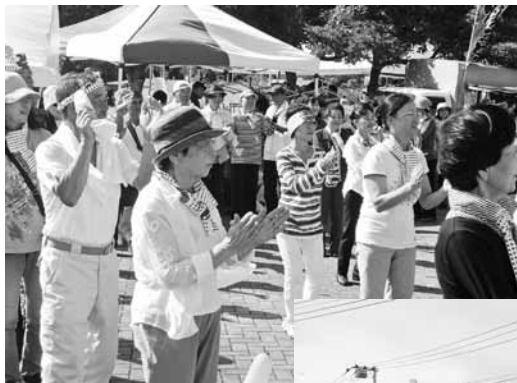
◀御宿台「秋祭り」 和太鼓の演奏に あわせ、絆音頭 を踊っています。