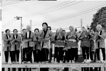
岩和田区▶ 「みなとまつり」 岩和田老人クラブ の皆さんによる踊 りの披露がありま した。

平成25年度町魅力ある地域づくり推進事業補助金 御宿台区「秋祭り」 岩和田区「みなとまつり」 町では魅力ある地域づくり活動を推進するために細制度を設け、地域住民の主体的なまちづくりを支援しています。 この補助金を活用し、10月12日（土）に御宿台区「秋祭り」が、11月2日（土）に岩和田区「みなとまつり」が実施されました。どちらのイベントも地域の皆さんの主体的な取り組みによって実施され、当日は大勢の方がイベントを楽しみ、住民同士の交流を深めました。