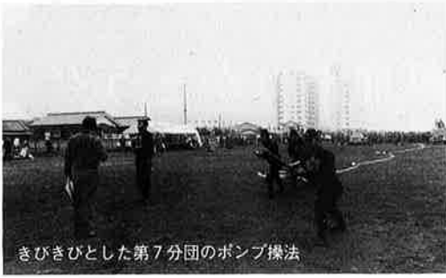
きびきびとした第7分団のポンプ操法

御宿町からは、ポンプ自動車の部に第七分団、小型ポンプの部に第十分団が、それぞれ出場しました。二チームとも団員の呼吸がピタリとあい、日頃の練習の成果がうかがえました。