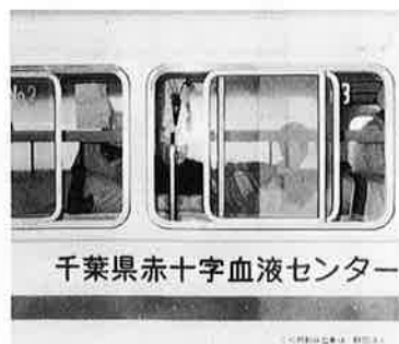
千葉県赤十字血液センター

娠・授乳期と言われます。増々暑 くなり、あっさりした食事に片寄 りがちな季節です。家庭の健康を 守るお母さん、是非これらのこと に注意して健康の増進を図って下 さい。 貧血についてくわしく知りたい 方、育児や家庭の健康について心 配がある方は、役場衛生係まで御 連絡下さい。