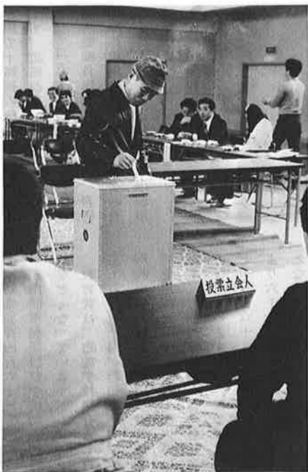
写真11としは選挙の年でした。今後四年間、新しい議員さんによって地方行政が運営されます。