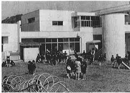
教育費については、施設への投

歳出予算は、十二の科目からなり、一番予算額の多いのが衛生費で予算全体の三十五・八%を占めています。ついで民生費の十六%以下総務費、農林水産業費、教育費、土木費などとなっています。毎年上位を占める教育費が五位、土木費が六位と位置づけががってきています。さらに災害復旧費は予備費について最下位から二番目。これは、復旧事業が、ほとんど後始末がついたことを示してい