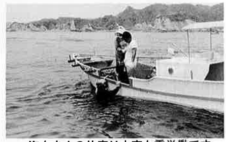
海女さんの仕事は大変な重労働です

五月二十日あわびが解禁になりました。今年の出足は良好、五月は三日の出漁で二千七百万、昨年は二千百万と、二十九パーセントの増でした。それでは今年は安くあわびが買える？とところが値段は入札で決まります。