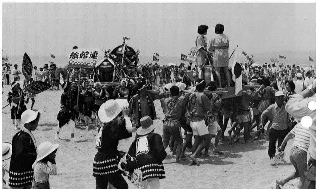
本みこし、タルみこしの乱舞