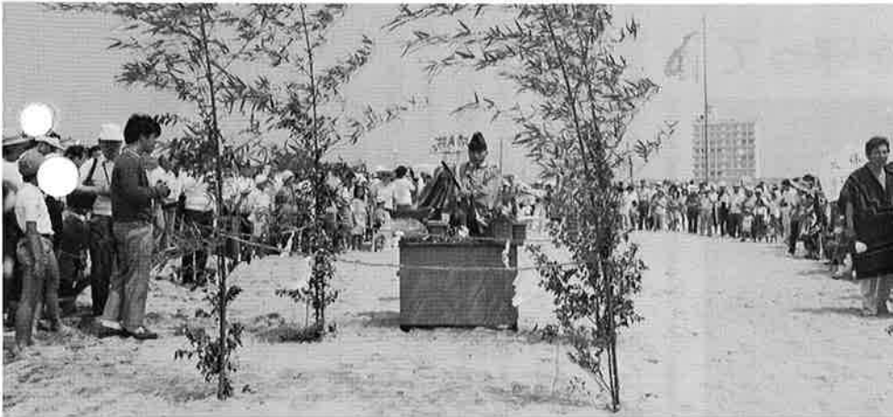
安全な海への祈り

テレビのスペイン語講座の講師をしていた事もあって、日本語はペラペラ、何みこしのあまりの揺れにも、「おーカミサマ」……。お国柄、とても陽気で情熱的、二人のセニヨリータに魅せられた男性も少くなかったようです。