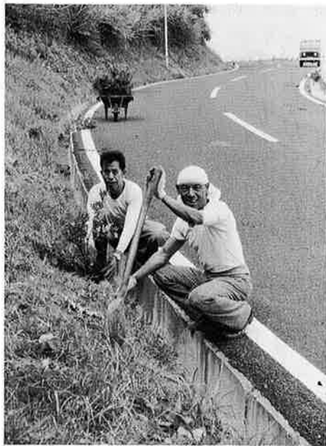
開花が楽しみな「さつき」