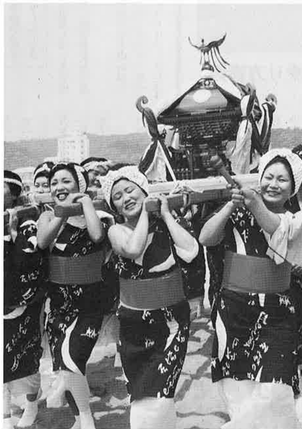
きれいどころも花やかに