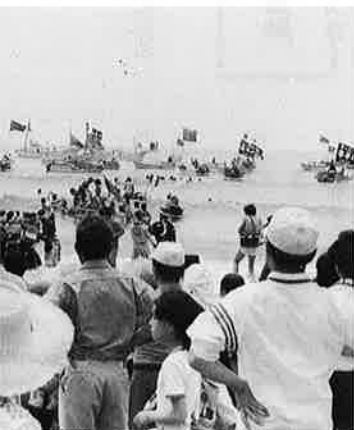
漁船団も海上から氣勢