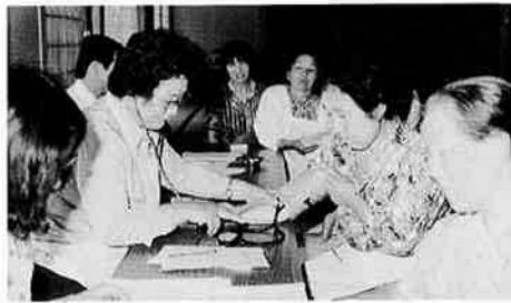
月一回無料で測定