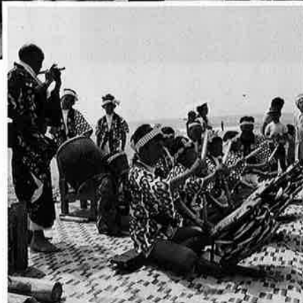
大人に負けじと子どもおはやしもハッスル⇒