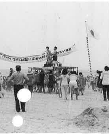
高々とメキシコとの友好横断幕