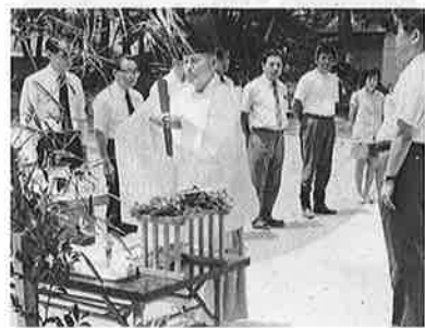
写真 学校に待望のプール。工事の安全と早期完成を祈って地鎮祭がとり行なわれた。