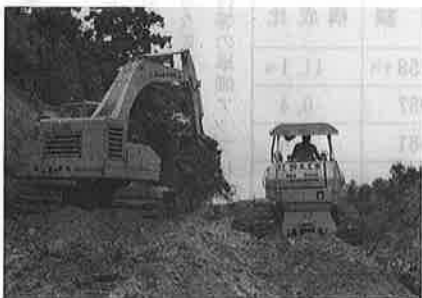
写真 ダム進入路の道はひらけた。いよいよ本体工事への着手も明るい見通しがたつた。

延長五百メートル、有効幅員、五、五メートルで完成は十一月末の予定です。この工事が完成しますと、ダム本体の着工に大きく前進することになります。