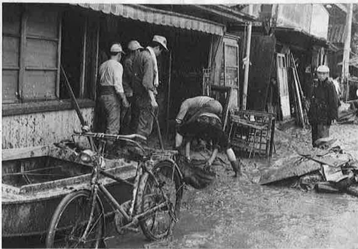
災害は忘れたころにやってくる。泥と水せめにあう被災地。

ことしも台風シーズンが近づきました。台風は、例年八、九月ごろになると日本に接近し、上陸するものが多くなり、これによって多くの尊い人命や財産が失われています。昨年一年間で、台風などの風水害による死者、行方不明者五百八十七人という非常に多くの犠牲者をだしています。