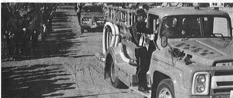
消防団員は少ないが、消防施設の整備は年々充実してきました。