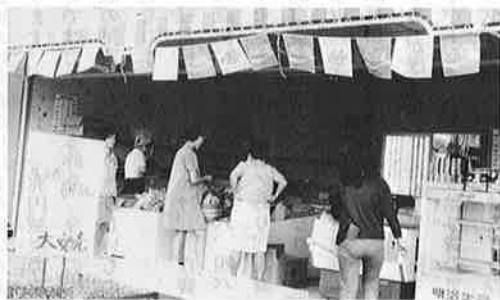
写真 大安売の立看板もむなく、客の入りはさえなかつた。