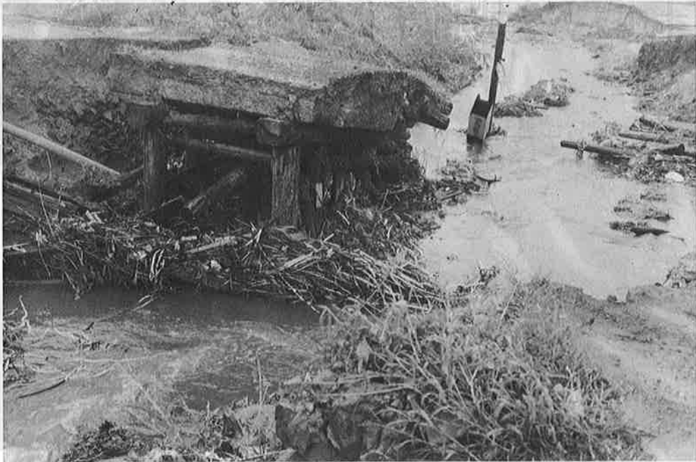
河川の決壊は思わぬ被害を招くおそれがあります。