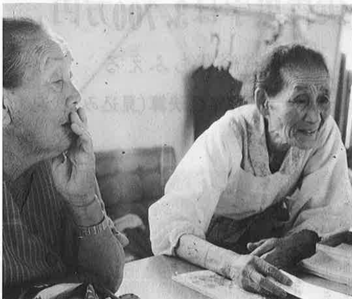
写真 おとしよりが役場窓口に見える時がよくあります。親切に案内しています。

きは、はなしはよくかみかみでいてわかりやすく説明していますからお気軽になんでもご相談ください。