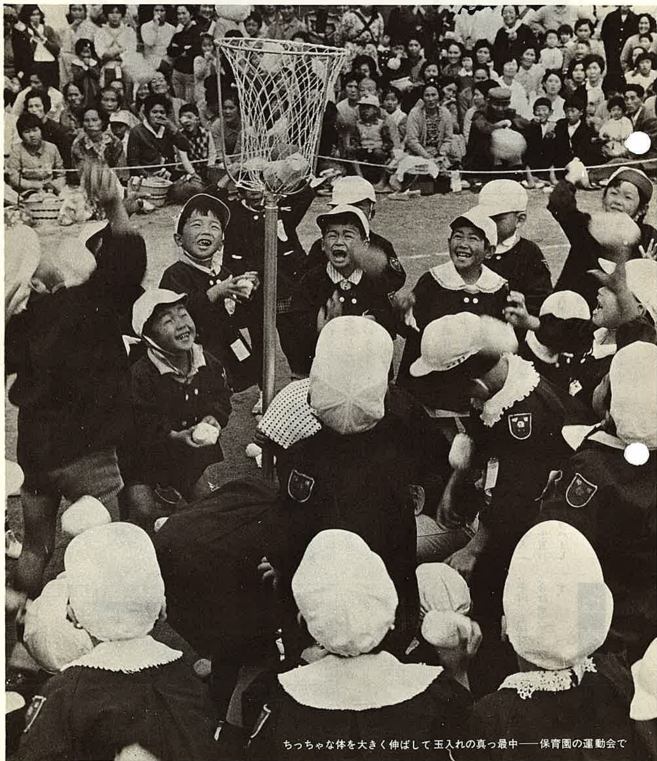
ちっちゃな体を大きく伸ばして玉入れの真っ最中——保育園の運動会で