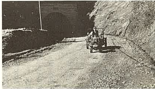
よくなった西林寺道路