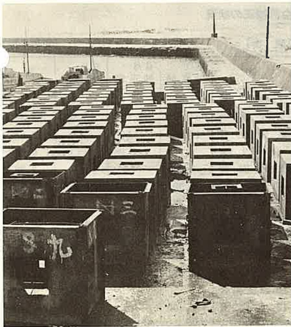
魚貝類のアパートとなる魚礁