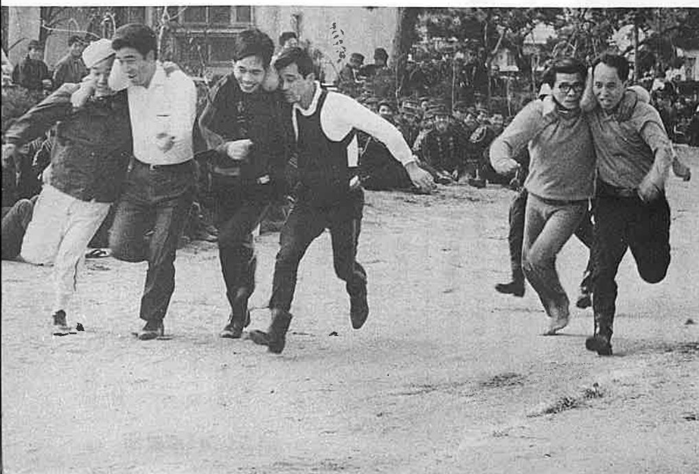
顔と顔の間に風船をはさんでヨーイドン

品され、大ぜいの人の目を楽しませていました。そしてもう一つ、午後から小学校音楽教室で開かれた民謡大会はたいへんな人気で会場は超満員。歌う人と聞く人が一体となって民謡を楽しむなど、各会場に集まった人は終始なごやかに文化の日を過ごしました。