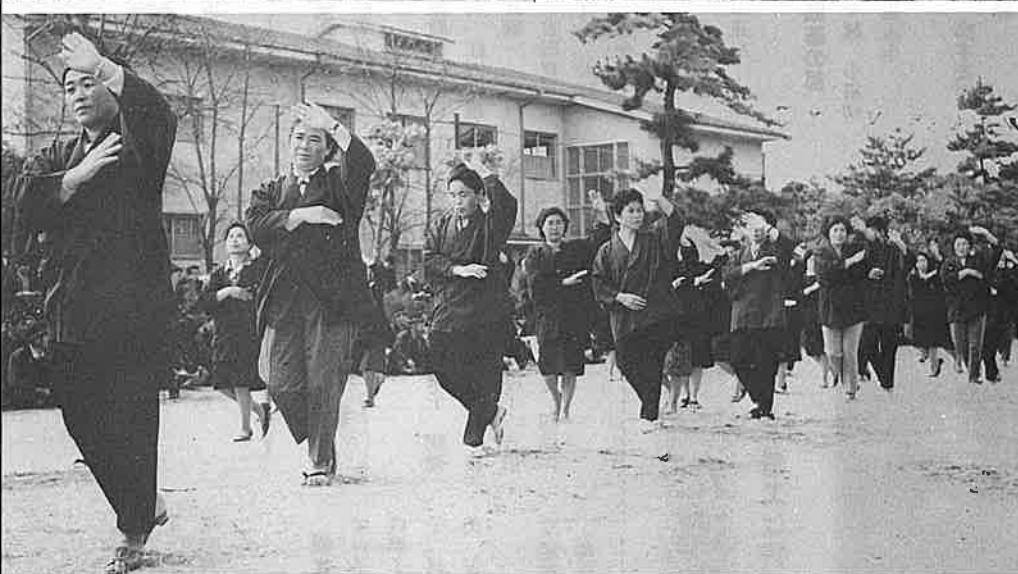
御宿音頭もまた楽し

品され、大ぜいの人の目を楽しませていました。そしてもう一つ、午後から小学校音楽教室で開かれた民謡大会はたいへんな人気で会場は超満員。歌う人と聞く人が一体となって民謡を楽しむなど、各会場に集まった人は終始なごやかに文化の日を過ごしました。