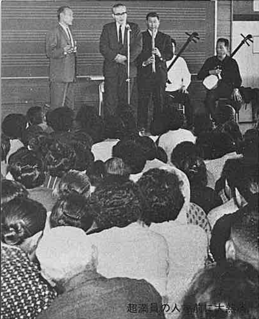
超満員の会場前に大勢の観衆