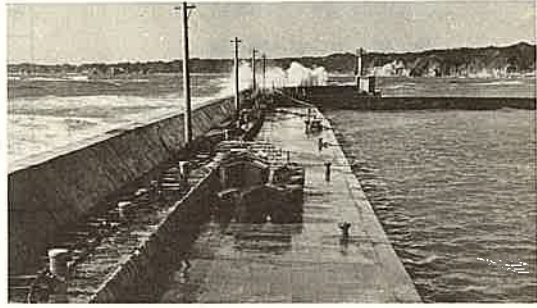
完成した岩和田漁港物揚場