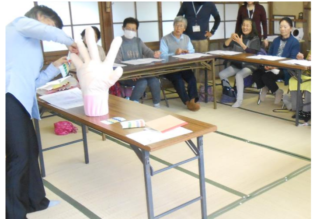
▲三育学院大学 教員による手洗いの講話風景

今回は、「インフルエンザ予防、大丈夫？あなたの手洗い」をテーマとした講話とオリーブの葉クッキー&ハーブティのお茶会を三育学院大学 看護学部 教員、管理栄養士と共に行い、地域住民の方を中心に23名の方と楽しく過ごしました。