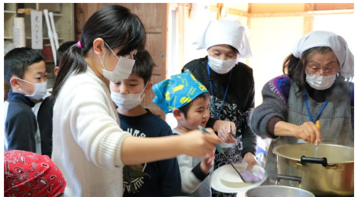
▲白玉団子を茹でている風景

今後も子どもも大人も交流できる「寄茶場」を地域住民の方を中心に考えていきたいと思えます。