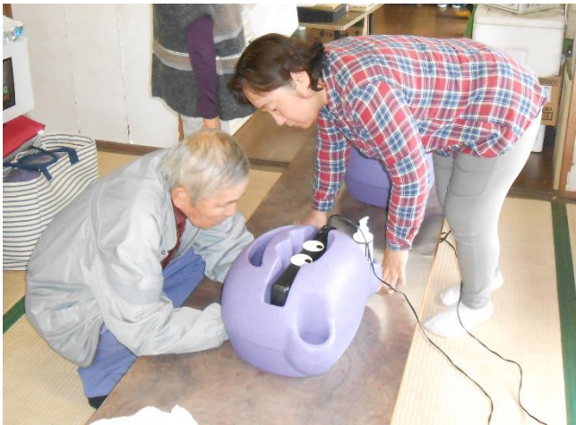
▲手洗いチェッカーで確認している風景

講話は、正しい手洗いを中心としたインフルエンザ予防のポイントについてお話がありました。実際に普段の手洗いがどの程度汚れを落としているのか、洗い残しがないか手洗いチェッカーを使い確認し、正しい手洗い方法について学びました。参加者の皆さんは、「思った以上に洗い残しがある」など驚きを隠せない様子であり、自分の手洗い方法を見直すきっかけとなりました。