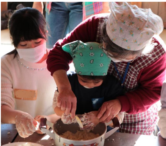
▲大人の声掛けのもと一緒に白玉をこねる風景

白玉団子作りでは、大人の声掛けのもと子ども達と一緒にこねたり、丸めたり、茹でたりと終始笑いながら楽しそうに作りました。