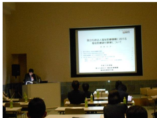
▲独立行政法人福祉医療機構の説明