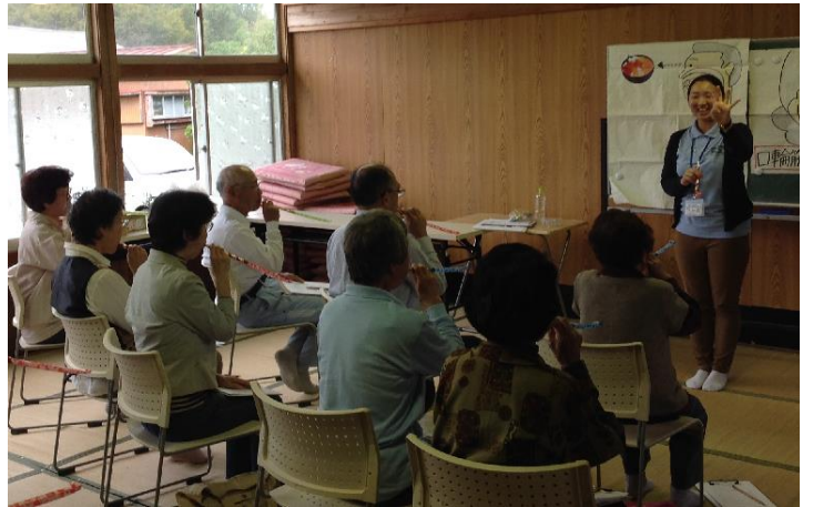
▲三育学院大学 保健師学生による吹き戻しによるトレーニング風景

当日は、なつかしいオモチャやハーブを使った健康づくり教室が開催され、介護予防サポーターや地域の方たちなど、23名の参加をいただきました。