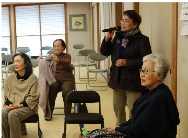
▲カラオケを皆さんで楽しみました

今回は、身体を動かすことや仲間と一緒に食事を楽しむことで、閉じこもりを予防することを目的とし、民生委員、ボランティアや民間事業者のご協力のもと実施しました。