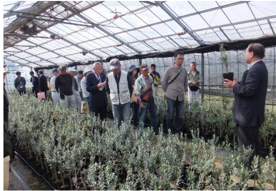
良質なオリーブの苗木の説明

講習内容： 良質な苗木の選定について 土作りや栽培の管理について 販売までの仕組みづくりについて