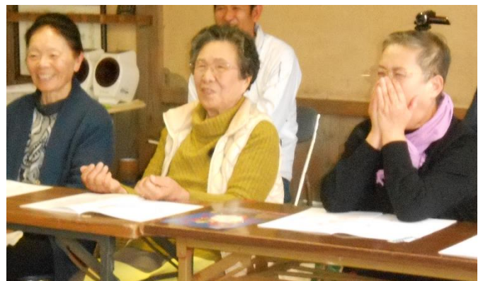
▲参加者同士、談笑している風景