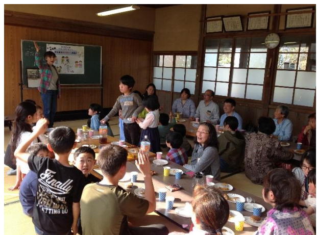
▲大人も子どももお茶会を楽しんでいます

また、オリーブ茶やオリーブの葉を使ったどら焼きでお茶会も行い、終始笑いが絶えることなく、賑やかな会となりました。