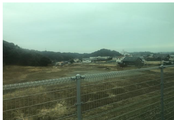
▲認定こども園に隣接する町有地

本町では、ひとり暮らし高齢者や高齢夫婦のみの世帯が増えてきており、介護・医療と連携して高齢者を支援するサービスを提供する住宅等の確保が重要となっています。今後もニーズを把握しながら、介護サービスの選択肢の充実を図ります。