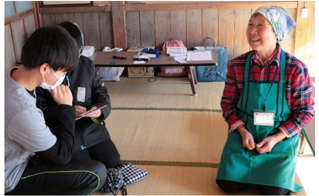
▲子どもたちと談笑する風景

今回は、「みんなでわいわい！白玉団子作り」をテーマに子どもから大人まで40名の方と一緒に交流しながら白玉団子を作りました。特に今回は、子どもたちの参加も多く、賑わった会となりました。