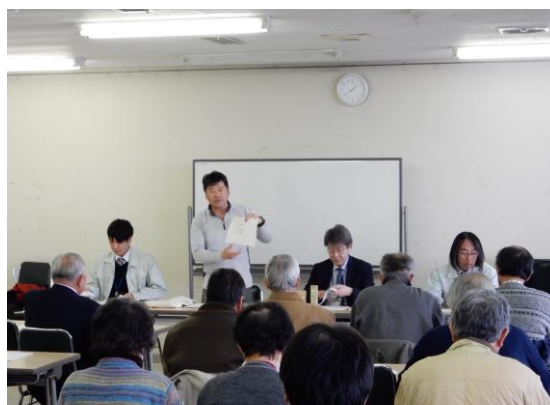
オリーブ栽培についての説明

オリーブ栽培は日照量が多いほど生育が良く、土壌は比較的乾燥を好むとされていますが、良好な生育、果実肥大のためには年間 1000 mm 程度の適度な降水が必要であることが分かりました。