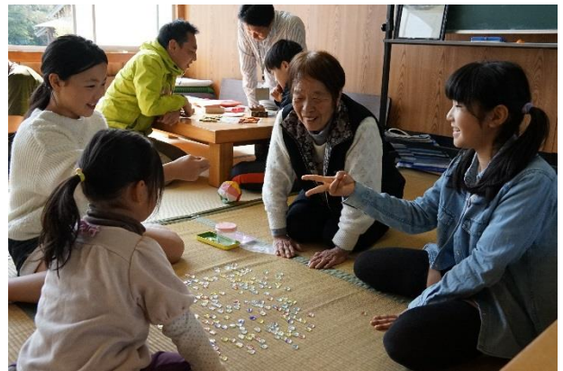
▲おはじきを一緒に楽しむ姿

今回は、「昔遊び」をテーマに子どもから大人まで46名の方と一緒にけん玉やメンコなど昔遊びをしました。子ども達が高齢者に昔遊びのやり方などを教わりながら一緒に楽しく遊んでいるのが印象的でした。