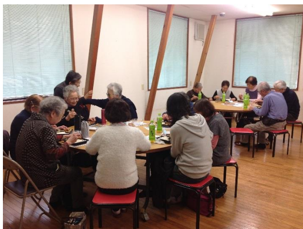
▲談笑しながらお弁当を食べている風景

また、普段よりサロン活動しているボランティアさんがサロンの魅力を伝えており、交流の場に行くきっかけや普及啓発活動に繋がることができました。今後も社会福祉協議会と協力しながら交流の場づくりに努めていきます。