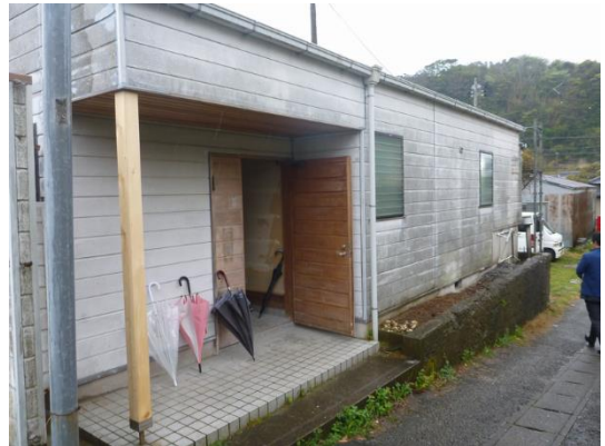
DECCO ハウス 玄関付近

お試し居住用住宅事業は、地域再生計画に基づき実施している地方創生推進交付金事業において、④移住・交流促進事業に位置づけられていて、お試し居住用住宅を借り上げ、移住したい方が御宿町ならではの暮らしを体験したり、地域のことを知る機会を得るために利用でき、移住者数の増加を目的としています。