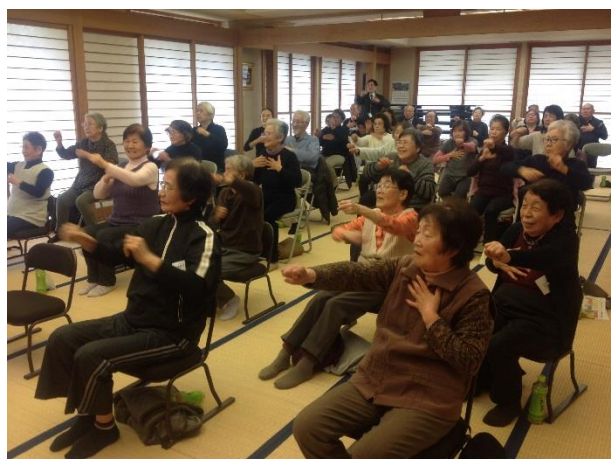
▲運動・脳トレーニングを行っている姿

一人暮らしの高齢者を中心に45名の方が参加され、身体を動かしたり、カラオケを楽しみました。また、町内の飲食店のお弁当を食べながら参加者同士、交流を楽しみました。