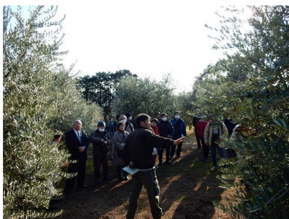
オリーブ圃場での説明

オリーブ栽培は日照量が多いほど生育が良く、土壌は比較的乾燥を好むとされていますが、良好な生育、果実肥大のためには年間 1000 mm 程度の適度な降水が必要であることが分かりました。