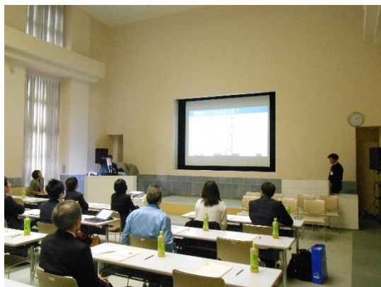
▲当日のセミナーの様子

その後は、独立行政法人福祉医療機構事業統括課より、同機構の紹介及び福祉医療貸付事業の説明を行いました。