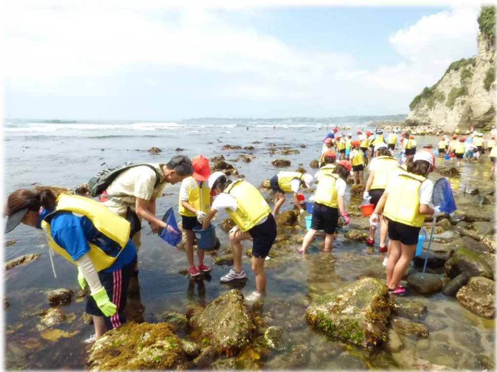
御宿小全校児童による地域学習『磯観察会』